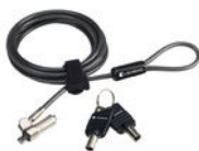
Verrou ultraplat pour câble avec clé - dynabook (PA5364U-1KCL)