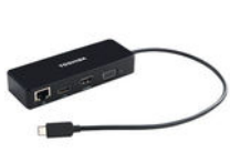
Adaptateur de voyage USB-C™-HDMI®/VGA (PA5272U-3PRP)