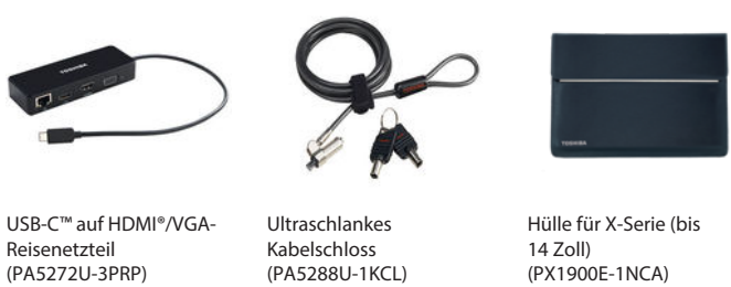
USB-C™ auf HDMI®/VGA-Reisenetzteil (PA5272U-3PRP)