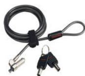
Verrou ultraplat pour câble avec clé (PA5288U-1KCL)