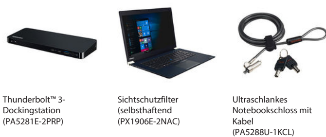
Thunderbolt™ 3-Dockingstation (PA5281E-2PRP)