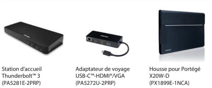
Station d'accueil Thunderbolt™ 3 (PA5281E-2PRP)