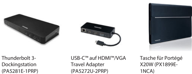
Thunderbolt 3-Dockingstation (PA5281E-1PRP)